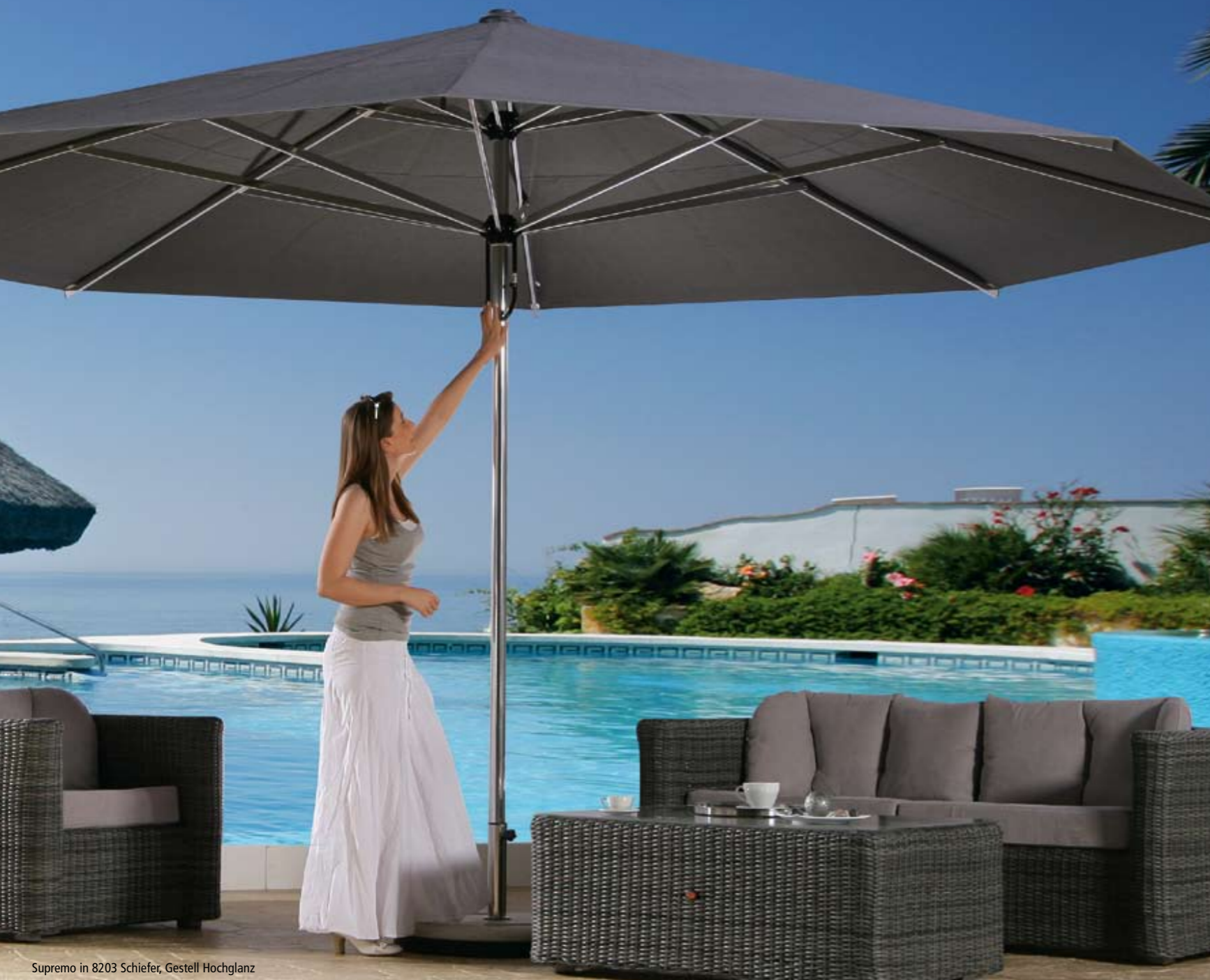
Supremo in 8203 Schiefer, Gestell Hochglanz

Öffnen und Schließen mit nur einer Hand. Beim Schließen fährt die Schirmspitze nach oben und der Schirm schließt über Tischhöhe. Die Tischdekoration kann stehen bleiben.