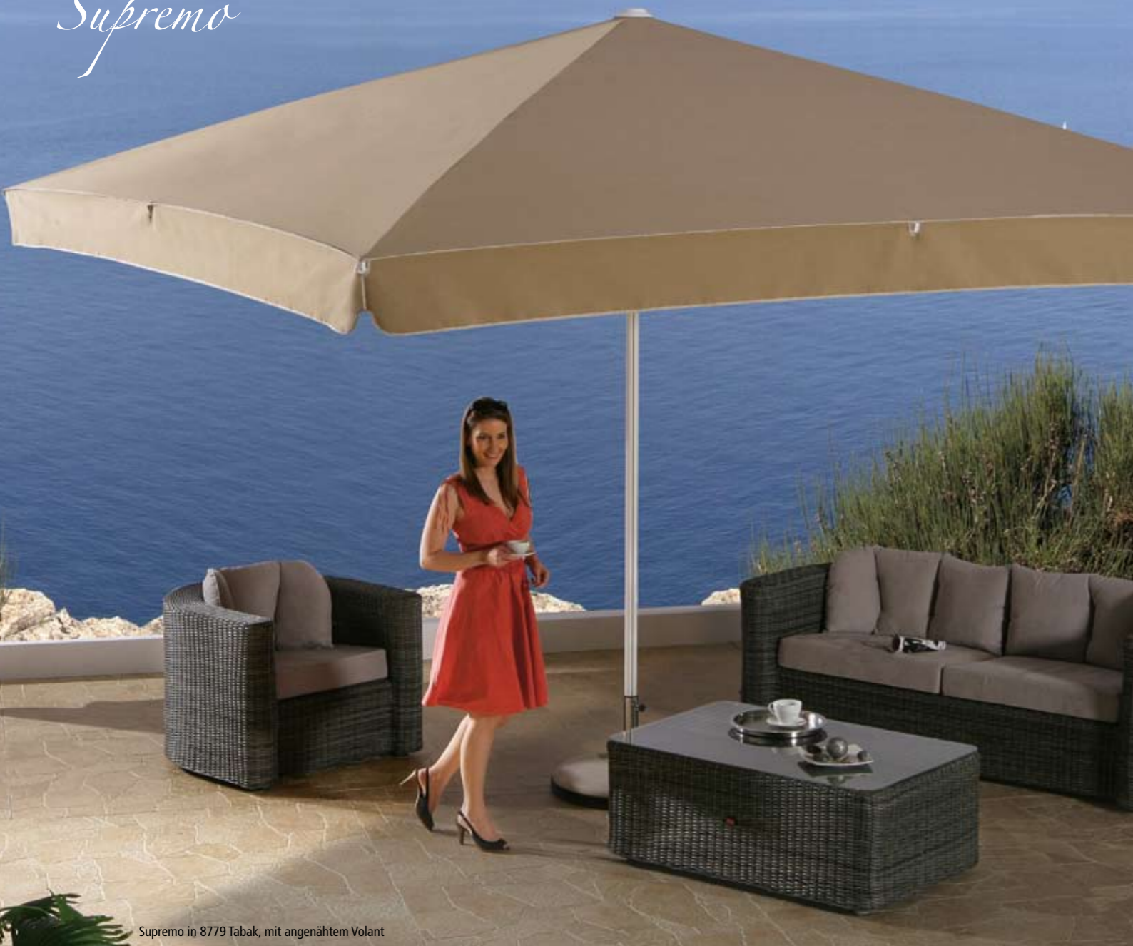
Supremo in 8779 Tabak, mit angenähertem Volant